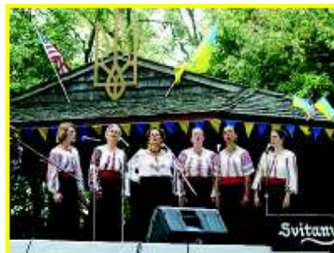
Ансамбль Світання ( Philadelphia )