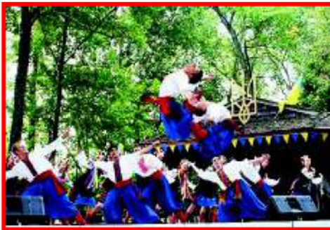
Танцювальний Ансамбль СИЗОКРИЛІ ( New York City )