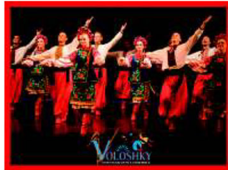
Танцювальний Ансамбль ВОЛОШКИ ( Philadelphia )